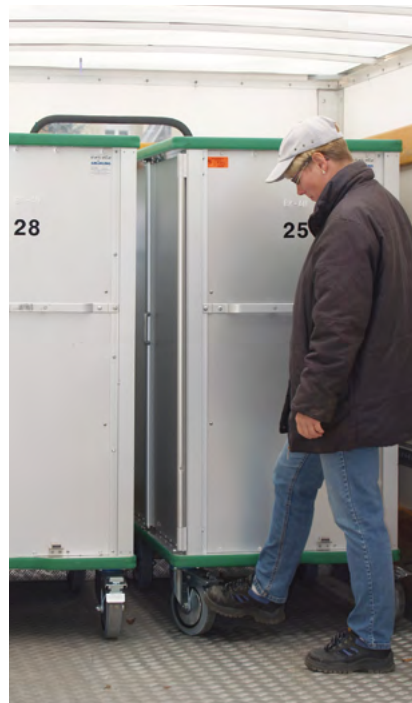
Carros armario de transporte en camión