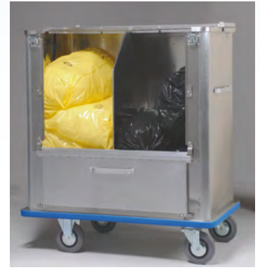
Carro de recogida de residuos