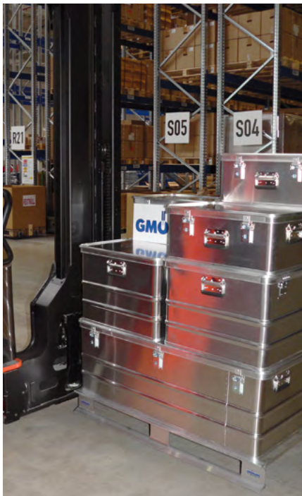
Cajas y palets en almacenamiento apilado