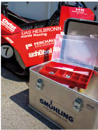
Caja de herramientas para el equipo de carreras

Ya sea para el uso óptimo de su capacidad de almacenaje, el transporte de mercancías o simplemente sus ciclos de trabajo, tenemos la solución adecuada a sus necesidades, a medida, individualizada e innovadora que le ahorrará tiempo en todos los casos.