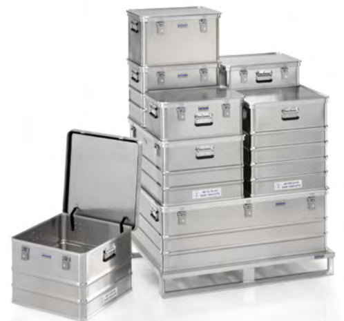
Embalaje de mercancías peligrosas (ADR)