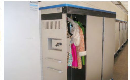
Carro armario para vestuario de teatro