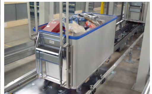
Carros de picking con transportador automatizado