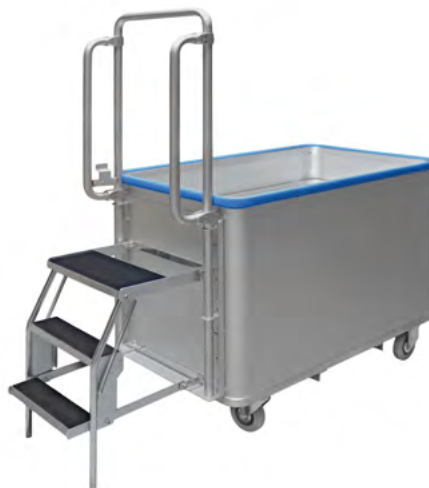
Carro de picking