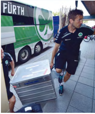
Para su equipo deportivo