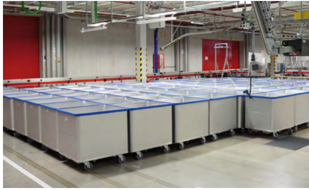
Carros de fondo móvil en el almacén